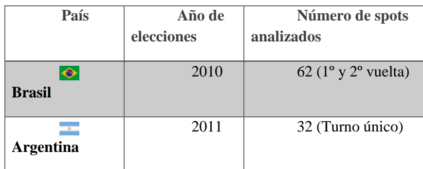
Tabla 1. Corpus empírico y año electoral de cada país analizado. 4

Por tanto, examinaremos los spots electorales en la propaganda televisiva de las campañas presidenciales de Dilma Rousseff (Brasil), Michelle Bachelet (Chile) y Cristina Kirchner (Argentina). Optamos por analizar los spots en vez de otro contenido de la campaña debido a su importante presencia en la programación televisiva, así como por la sintetización de los temas electorales. La selección del corpus es una opción metodológica y resaltamos la importancia de realizar futuros estudios comparativos con otros géneros, como los programas electorales y las websites de campaña. En este estudio nos detenemos en el análisis de los spots, presentando, a continuación, el total del corpus analizado: